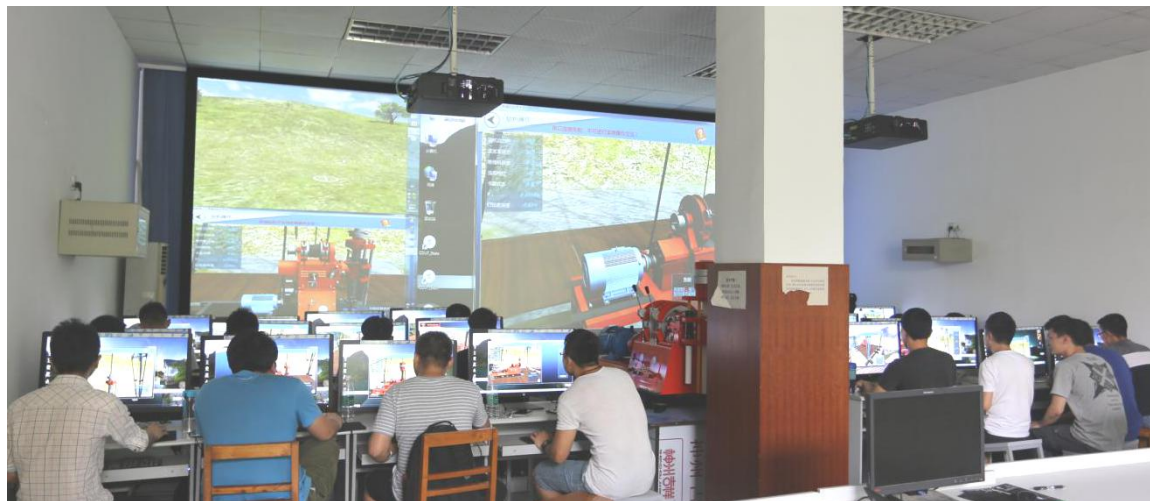
图1 地质钻掘虚拟实验

建了地质（岩土）工程模块化、层次化的“三三三”新型虚拟仿真实验教学体系（见图2）。通过经费、人力和物力的持续投入，建成了全国首个地质与岩土工程国家级虚拟仿真实验教学中心（以下简称中心），解决了长期制约地质（岩土）工程专业实践教学中高危与不可重现等瓶颈问题。